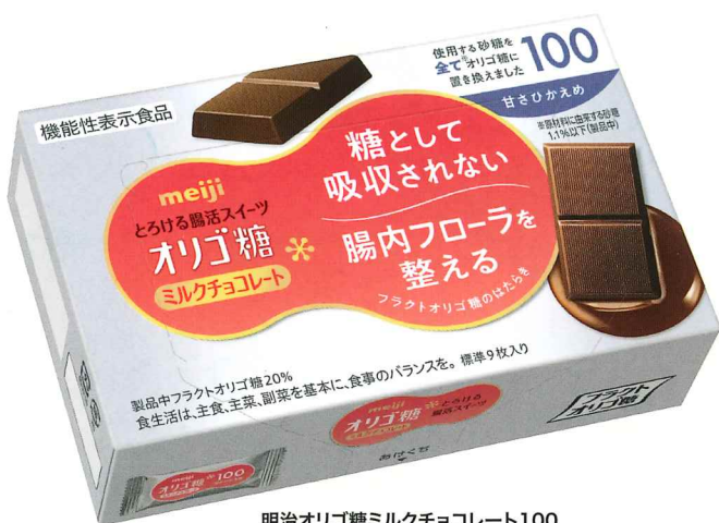
明治オリゴ糖ミルクチョコレート100

使用する砂糖の半分をフラクトオリゴ糖に置き換えた、ミルクたっぷりのリッチミルクチョコレートです。健康を考えた、甘くておいしい腸活チョコレートをお愉しください。