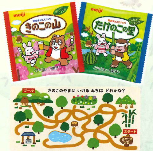
裏面には迷路ゲームを掲載!