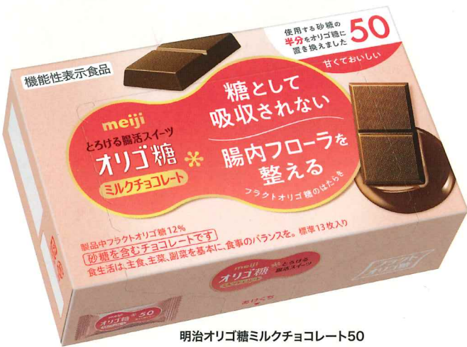
明治オリゴ糖ミルクチョコレート50