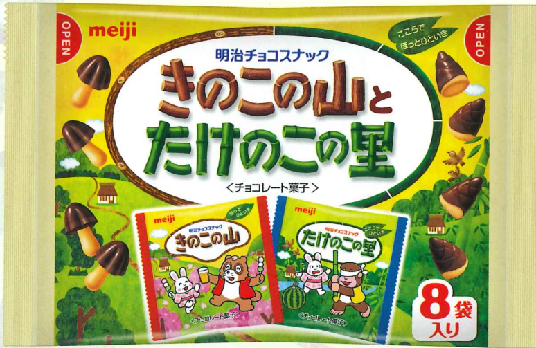
きのこたけのこ袋