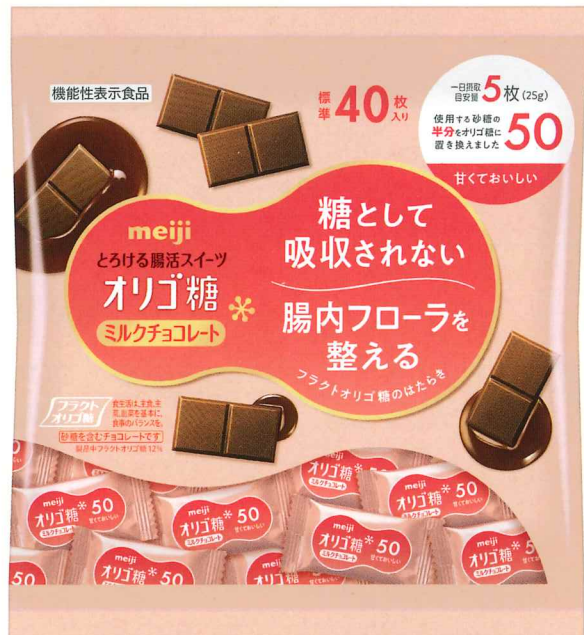
明治オリゴ糖ミルクチョコレート50大袋

●明治オリゴ糖ミルクチョコレート100は、使用する砂糖を全てフラクトオリゴ糖に置き換えた、甘さひかえめのミルクチョコレートです。